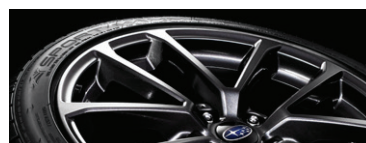
18" легкосплавные диски