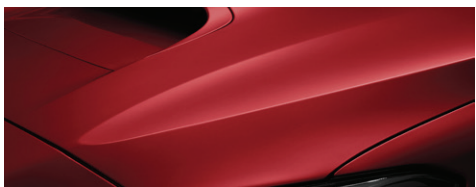
Красный (Pure Red)