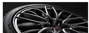
18" легкосплавные диски STI